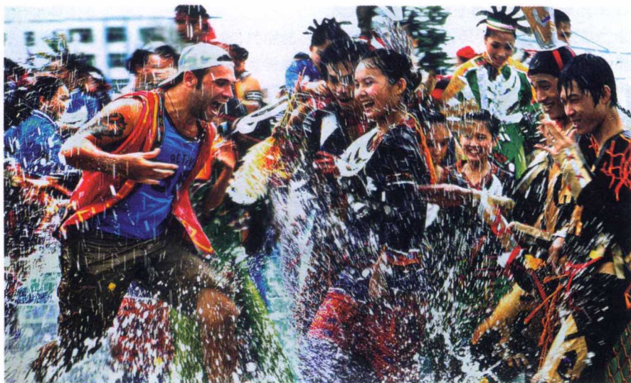
蕴含黎族深厚文化内涵的七夕保亭嬉水节深受中外游客的喜爱

中传承下来的文化现象。任何节庆活动的兴起都不是偶然的，它是历史发展的产物，具有一定的物质基础和文化渊源。因此，笔者以为，旅游节庆活动应该慎行。慎行，是指在举办活动时要调研、考察，广泛征求人民群众的意见。活动要精，不要太泛滥。以文化构建旅游节庆活动，具体说来需要注重以下五个方面的问题。