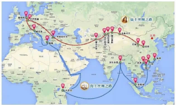
图 2 中国“一带一路”战略路线图