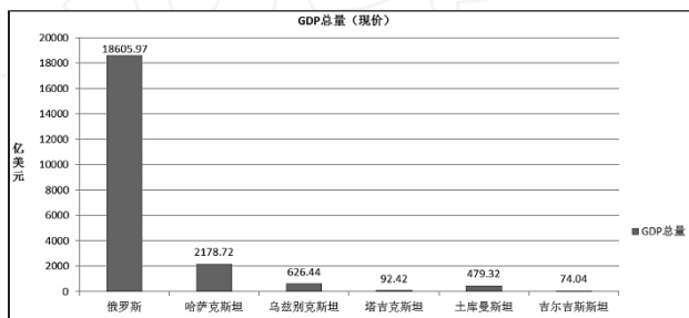
图3 2014年中亚及俄罗斯GDP总量(美元.现价)

图3是2014年俄罗斯及中亚五国的GDP总量,单从GDP总量看,俄罗斯的经济总量远远大于中亚五国之和,约为中亚总量的五倍。哈萨克斯坦是中亚最大的经济体,经济总量占到该地区经济总